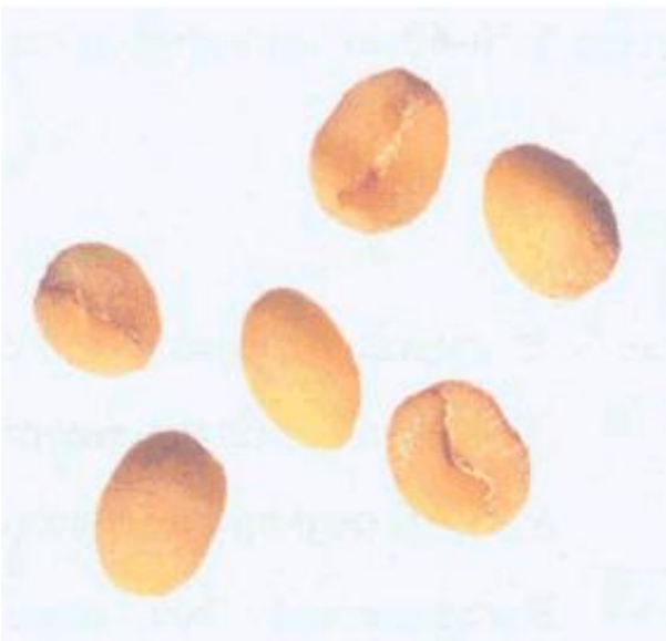
Рисунок С.14 - Янтарное зерно (см. 4.4)