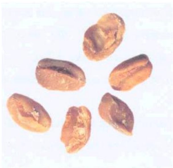
Рисунок С.5 - Зерно неправильной формы: вмятины (см. 3.1)