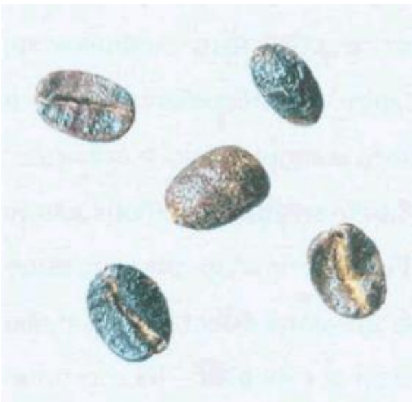
Рисунок С.12 - Черно-зеленое зерно (см. 4.2)