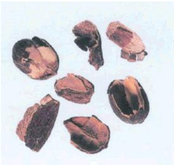
Рисунок С.4 - Часть плодовой оболочки (см. 2.4)