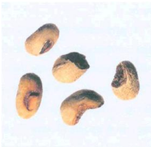
Рисунок С.10 - Зерно, поврежденное при пульпировании (см. 3.6)