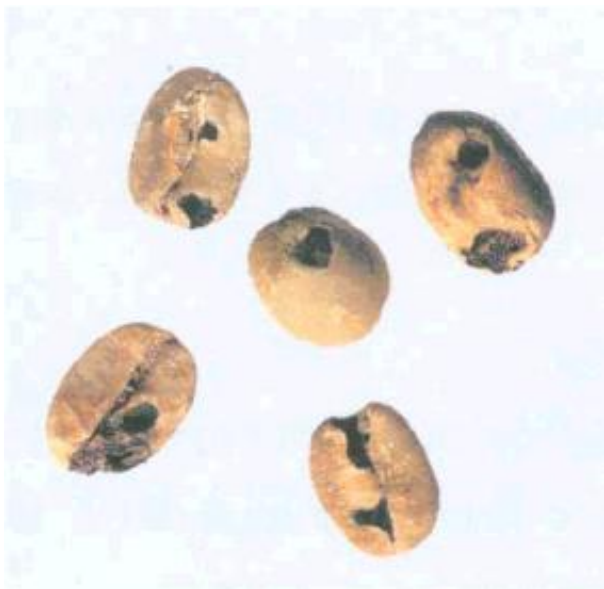
Рисунок С.9 - Зерно, поврежденное насекомыми (см. 3.4)