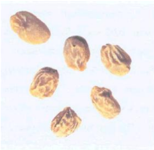
Рисунок С.18 - Сморщенное зерно (см. 4.8)