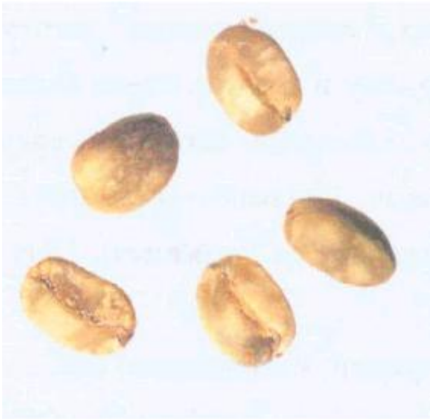
Рисунок С.17 - Пятнистое зерно (см. 4.7)