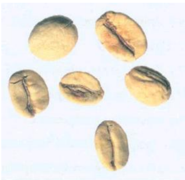
Рисунок С.20 - Белое зерно (см. 4.10)