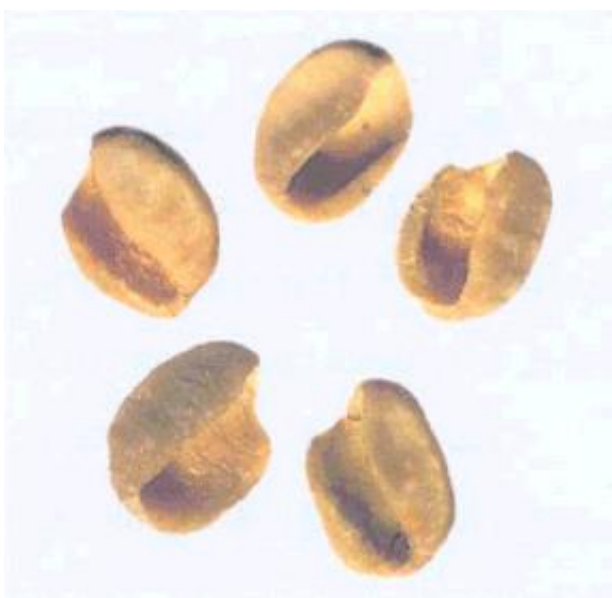
Рисунок С.6 - Зерно неправильной формы: раковины (см. 3.1)