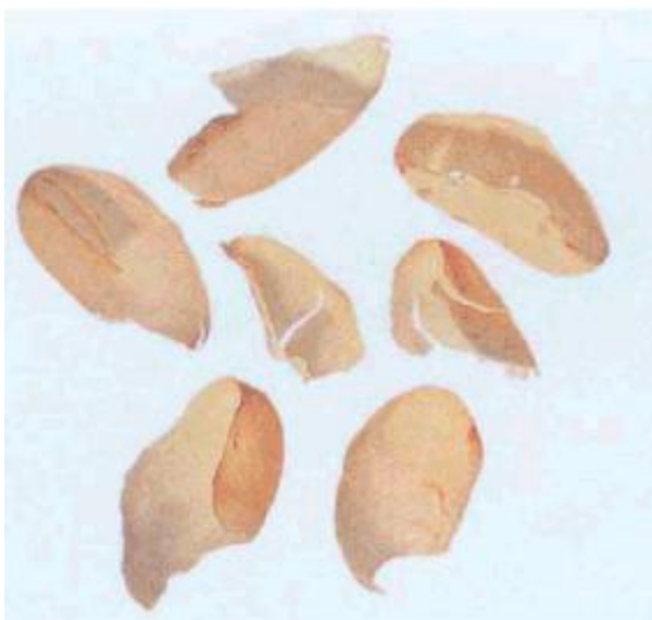
Рисунок С.2 - Часть пергаментной оболочки (см. 2.2)