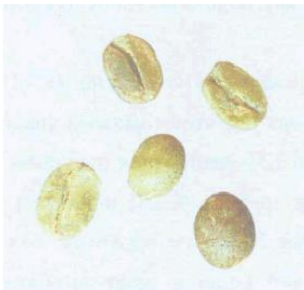
Рисунок С.15 - Незрелое зерно; неразвившееся зерно ("quaker") (см. 4.5)