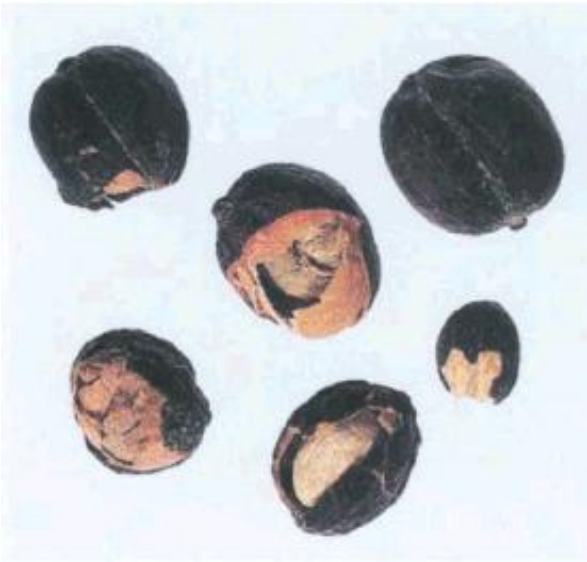
Рисунок С.3 - Сухой кофейный плод (см. 2.3)