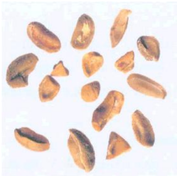
Рисунок С.7 - Обломки зерна (см. 3.2)