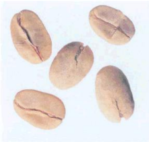
Рисунок С.1 - Зерно в пергаментной оболочке (см. 2.1)