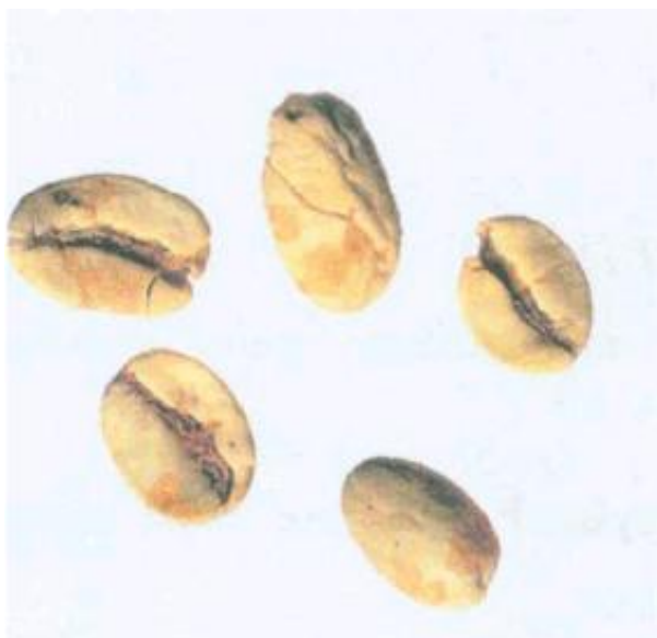
Рисунок С.19 - Губчатое зерно (см. 4.9)