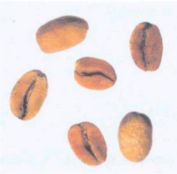
Рисунок С.13 - Коричневое зерно ("ardido") (см. 4.3)