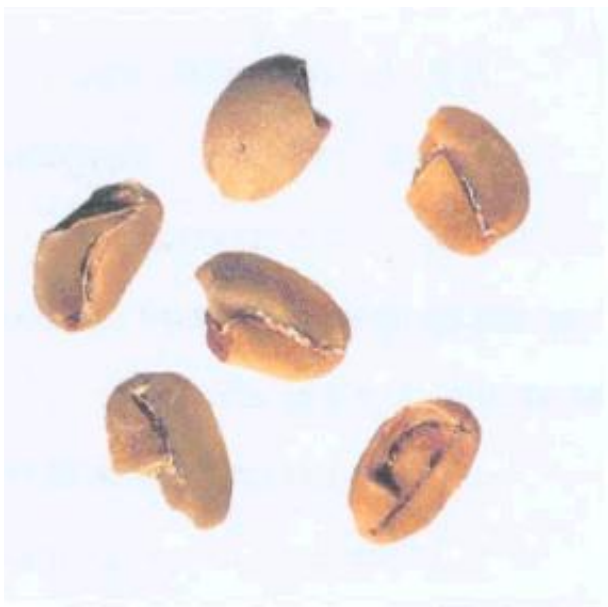
Рисунок С.8 - Ломаное зерно (см. 3.3)