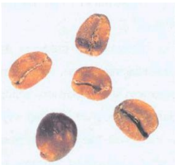
Рисунок С.16 - Восковидное зерно (см. 4.6)